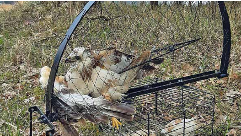
Habichtfangkörbe werden fast ausschließlich zum illegalen Fang von Greifvögeln – hier ein Mäusebussard – verwendet.