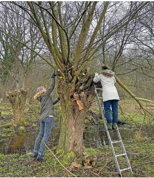
Kopfweidenpflege in den Komitee-Schutzgebieten.

weitere Flächen hinzu: Umliegende Wiesen und Weiden, Hecken und Hügel wurden nach und nach aufgekauft und in die Schutzflächen integriert. Auch die ehemalige Gemeinde Raisdorf –