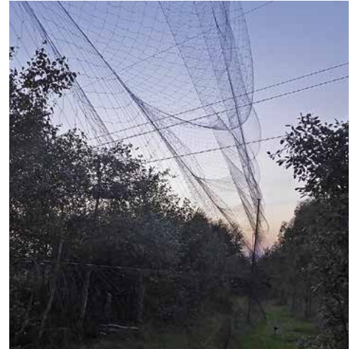
Fangnetz an der „Zuchtanlage“ des italienischen Wilderers in Polen.

im Herbst – wenn sie wieder ans Tageslicht geholt werden – vorgaukeln, es sei Frühling. Die aus dem jahreszeitlichen Takt gebrachten Tiere locken mit ihrem Gesang Artgenossen vor die Flinten. Rund 850.000 Lockvögel sind zu diesem Zweck in Italien in Haltung. Die Jagd mit Lockvögeln ist weit effektiver als jede andere Jagdmethode. Da ein Verbot der