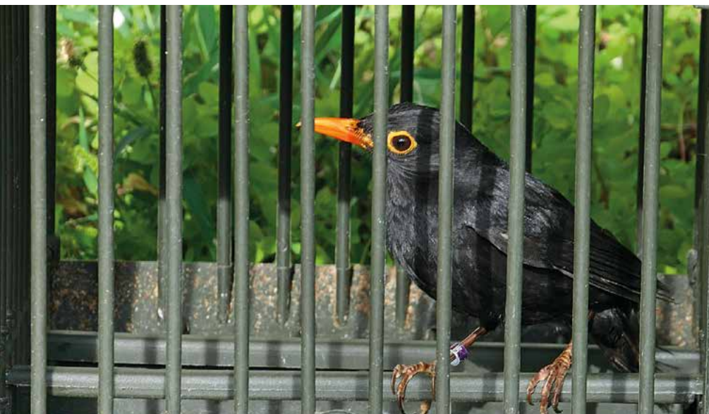
Die Singvogeljagd ist mit lebenden Lockvögeln – hier eine Amsel – besonders effektiv.

Früher wurden die benötigten Lockvögel mit riesigen Netzen in staatlichen Fanganlagen ganz legal gefangen. Das Komitee hat jahrelang zusammen mit seinem italienischen Partner LAC dagegen prozessiert und letztlich gewonnen. Seit 2011 sind die Fanganlagen geschlossen. Eine andere Quelle zur Beschaffung der Lockvögel sind illegale Fangnetze, die die Jäger privat aufstellen. Die Methode ist seit langem verboten. Weil große und ortsnahe Fangplätze heutzutage viel zu auffällig sind, haben sich die Wilderer in abgelegene Bergregionen zurückgezogen. Eine weitere Methode, um illegal an Lockvögel zu gelangen, ist das Ausnehmen von Drosselnestern während der Brutzeit. Besonders verbreitet ist dieses Phänomen in den riesigen Obst-