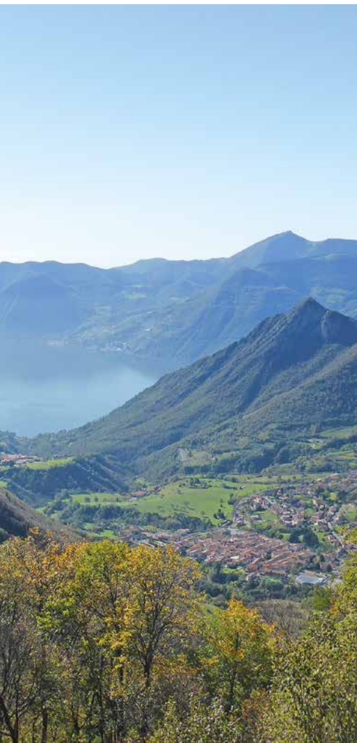
Der Bergdorf Zone – die inoffizielle Hauptstadt der Bogenfallen-Tradition – trohnt hoch über dem Iseosee.