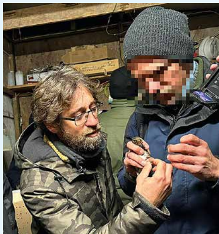
Kontrolle der Ringe bei dem „Zuchtbetrieb“ in Danzig: Kein einziger Ring war ordnungsgemäß.

station Ostoja übernommen. Die Vögel können bereits wenig später freigelassen werden. In der Fanganlage wird ein halbes Dutzend Netze gefunden, in den Wohngebäuden zudem Geschäftsunterlagen und Smartphones. Doch die erhofften Informationen zu Abnehmern und Hintermännern scheinen nicht dabei zu sein. Als die Beamten die Durchsuchung gerade beenden wollen, klingelt dumpf ein Telefon. Ein Polizist geht dem Klingelton nach und findet das Gerät gut versteckt zwischen den Polstern eines Sofas. Nach so viel Pech darf man auch