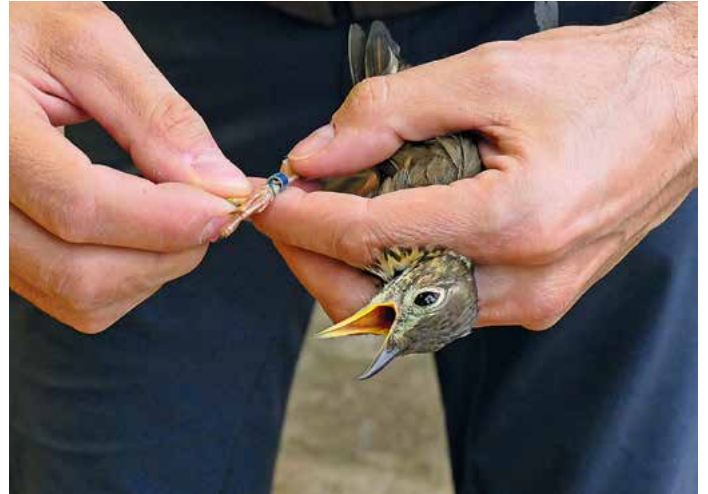
Gezüchtete Lockvögel müssen mit Ringen versehen sein. Bei Kontrollen werden vielfach Manipulationen festgestellt.

plantagen in Südtirol, wo jedes Jahr mehrere tausend Jungvögel aus den Nestern geklaut werden. Doch auch hier ist der Aufwand groß und der „Ertrag“ deckt den Bedarf der Jäger bei weitem nicht ab. Um die große Nachfrage zu bedienen, fluten fadenscheinige Händler seit einigen Jahren den Markt mit angeblich in Gefangenschaft vermehrten Tieren. Zwar ist es möglich, Drosseln zu züchten, doch die Kosten sind hoch und die Erfolge vergleichsweise bescheiden.