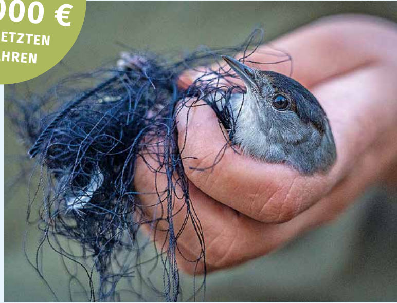
Schutzbedürftig: Diese Mönchsgrasmücke ist einer von insgesamt 2.832 Vögeln, die im letzten Jahr von uns aus Netzen, Fallen oder illegaler Haltung befreit wurden.

GELDSTRAFEN FÜR WILDEREI IN HÖHE VON 500.000 € IN DEN LETZTEN DREI JAHREN