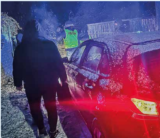
Razzia bei der italienischen Schmugglerbande in Polen im November 2023.

konkrete Informationen über eine größere Lieferung Lockvögel, die an einem bestimmten Tag nach Italien gebracht werden soll. Die übliche Route und das Nummernschild des Fahrzeugs sind von den Aufzeichnungen der versteckten Kameras vom Vorjahr bekannt. Mehrere italienische Polizei-Patrouillen sowie ein Komitee-Team legen sich entlang der vermuteten Strecke auf die Lauer. 15 Stunden und tausende Fahrzeuge später wird die Aktion abgebrochen. Die Täter haben auf dem Weg vermutlich das Fahrzeug getauscht und die Vögel