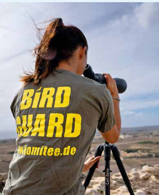
Unsere britische Mitarbeiterin auf Malta bei der Observation von Finkenfängern (links). Komitee-Mitarbeiter mit libanesischen Polizisten im nördlichen Libanongebirge (unten).