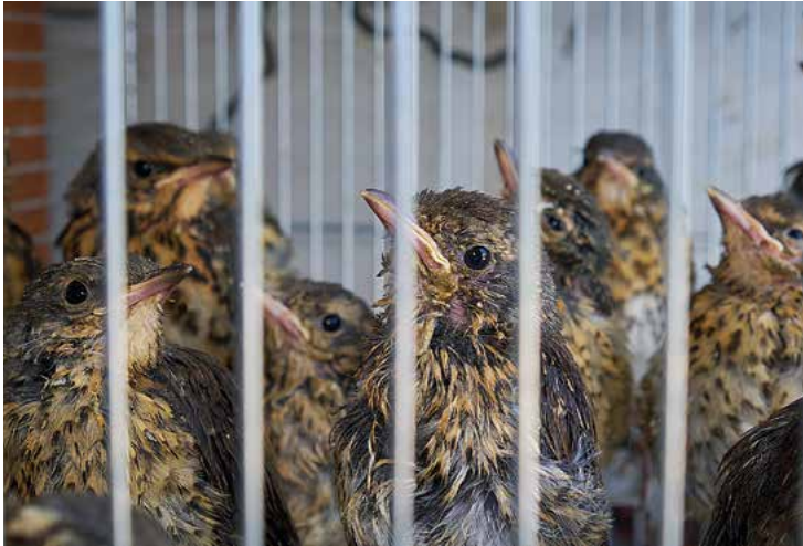
Singsdrosselkükeln, sichergestellt bei einem Nesträuber in der Lombardei (Norditalien).