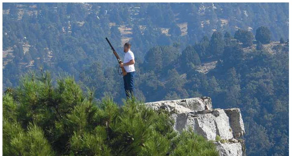
Warten auf die Adler. Viele Wilderer positionieren sich auf Felsvorsprüngen in der Nähe der Rastplätze.

Wie tief das Problem der Vogeljagd in der Gesellschaft verwurzelt ist, zeigte sich beispielhaft am 18.09.2023 – einem Tag mit außergewöhnlich starkem Zuggeschehen – an einem Schlafplatz in der Nähe des Bergdorfes Akkar-Attiqua. Wir hatten aus der Ferne bereits mehrere Abschüsse von Wespenbussarden gefilmt, als sich aus dem Tal eine ganze Kolonne von Fahrzeugen, darunter ein voll besetzter Schulbus, näherte. Teilweise wurde bereits aus den fahrenden Autos heraus auf die sehr flach über die Straße fliegenden Tiere geschossen. Der Schulbus hielt auf